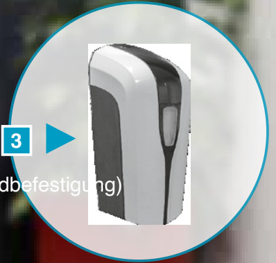
MODELL 3 (zur Wandbefestigung)