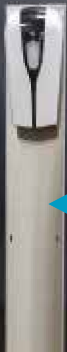
MODELL 1 (inkl. Auffangschale)