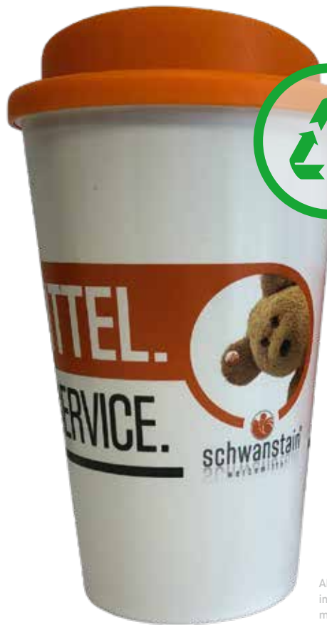
Abb.: 350 ml Becher inmould-Druck mit Schraubdeckel